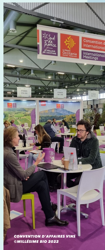
CONVENTION D'AFFAIRES VINS

Pour un premier contact, écrivez-nous à contact@agence-adocc.com ou appelez-nous : · Toulouse, La Cité : 05 61 12 57 12 · Montpellier, Cité de l'Économie et des Métiers de Demain : 04 67 85 69 60 · Pérols : 04 99 64 29 29